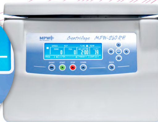
MPW-260, MPW-260R, MPW-260RH