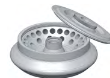
WIRNIKI HORYZONTALNE SWING-OUT ROTORS